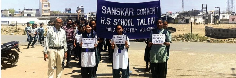
▶▶ तलेन