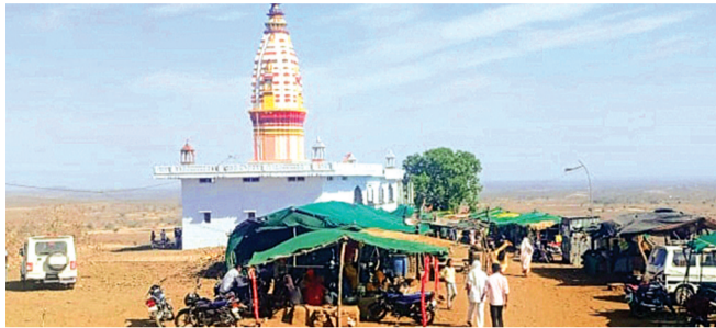
हरिभूमि न्यूज ▶▶ राजगढ़

होड़ावाली माता मंदिर का मामला, धर्मस्व विभाग से स्वीकृत हुई थी 6 करोड़ की राशि