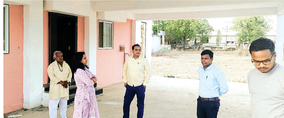
हरिभूमि न्यूज ►► नलखेड़ा

हरिभूमि में प्रमुखता से समाचार प्रकाशन के बाद मां बगलामुखी मंदिर प्रबंध समिति हरकत में आई है। 16 माह पूर्व लोकार्पित तीर्थ यात्री सेवा सदन एवं तीर्थ यात्री विश्राम गृह का उपयोग आगामी नवरात्रि पर्व पर प्रारंभ किए जाने का निर्णय लिया गया है। इनके लिए आवश्यक संसाधन जुटाने का कार्य प्रारंभ किया जा चुका है। गुरुवार को हरिभूमि द्वारा 16 माह