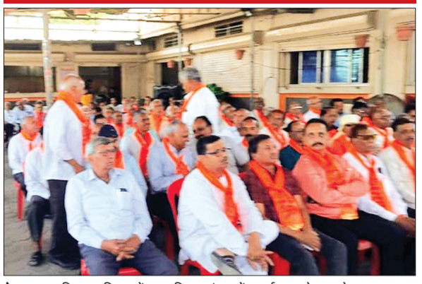
देवास। स्वस्तिक परिसर में हुआ विद्युत मंडल पेंशनर्स का स्नेह सम्मेलन।

पेंशनरों की मांगों के संबंध में डाला प्रकाश