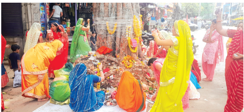
हरिभूमि न्यूज ▶▶ राजगढ़

होलिका पर्व के दसवें दिन आने वाले दशामाता व्रत पर्व पर गुरुवार को सनातनी श्रद्धालु महिलाओं द्वारा व्रत, उपवास रखते हुए पीपल के वृक्षों की पूजा-अर्चना की गई। महिलाओं द्वारा विधि-विधान के साथ वृक्षों पर मनोकामना संबंधी धागा अर्पित करते हुए परिक्रमाएं करते हुए परिवार की सुख-समृद्धि की कामना की गई। नगर के विभिन्न पीपलवृक्षों के यहां पूरे दिन महिलाओं द्वारा पूजा-अर्चना का कार्यक्रम चलता